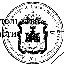
А. Е. Клычков

Председатель Правительства Орловской области